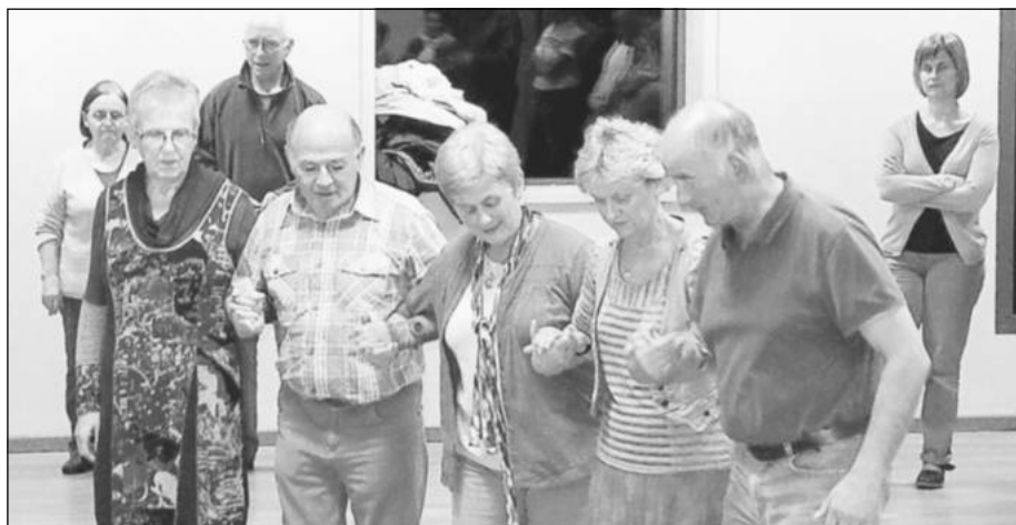
Les participants à l'assemblée générale ont repris, après la réunion leur activité favorite : la danse.